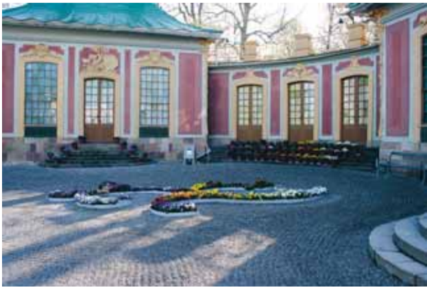
Blomstertrappa på Kina slott i Drottningholmsparken som den såg ut i fjol. För andra året i rad arrangeras blomsterutställning där besökarna möts av 120 sorters penséer.