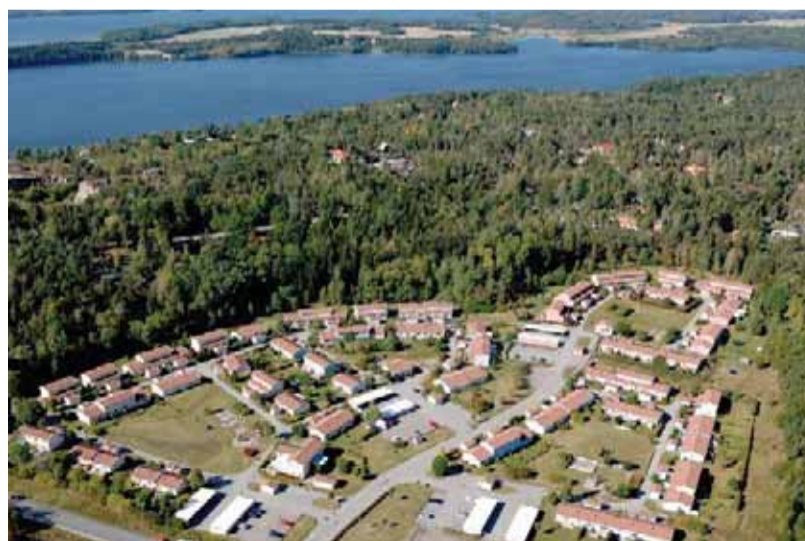
Flygfoto över Söderströms väg, Stenhamra

Vill du veta mer så kontakta Ekerö Bostäders bostadsförmedling eller gå in på hemsidan www.ekerobostader.se där också lediga objekt publiceras.