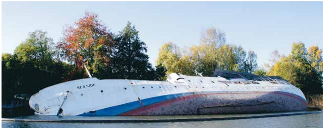
Seaside strax efter kantringen den 23 september förra året. Meningen var då att fartyget skulle avlägsnas på ett eller annat vis snarast möjligt. När denna artikel skrevs fanns ännu inget beslut om när och hur Seaside ska tas bort.

Ekerö rederi har på uppdrag från KFM ombesörjt ol-