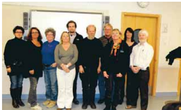
Ö-partiets styrelse är oförändrad från förra året.