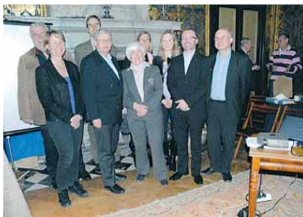
Ny styrelse för Moderaterna valdes vid årsmötet på Stafsvunds gård.