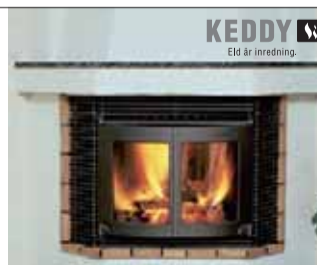
Keddy 510 Pris 13.510:- 639:-/mån

Se aktuella kampanjerbjudanden på www.bastuspecialisten.se