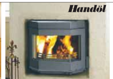
Handöl Panorama Pris 13.320:- 631:-/mån