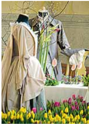
Bild från utställningen "Historisk Vår" i Déjeunersalongen, Drottningholms slottsteater.

DROTTNINGHOLM | Blomsterprakt, teaterkostymer, festliga dukningar eller dukat för fika i gröngräset med spirande vårkänslor... dessa idéer ligger bakom vårens blomsterutställning "Det dukade blomsterbordet – till fest och till vardags" på Drottningholm.