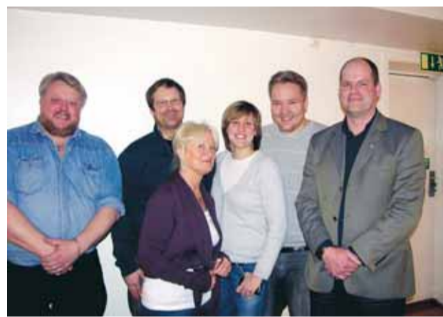
Socialdemokraternas nya styrelse utsågs vid årsmötet den 14 mars.

MÄLARÖARNA | De politiska partierna på Mälarearna har haft sina årsmöten med partiprogram och styrelseval på dagordningen.