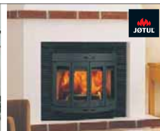
Jøtul 400 Harmony Pris 16.600:- 773:-/mån Täckgaller är extra utrustning.