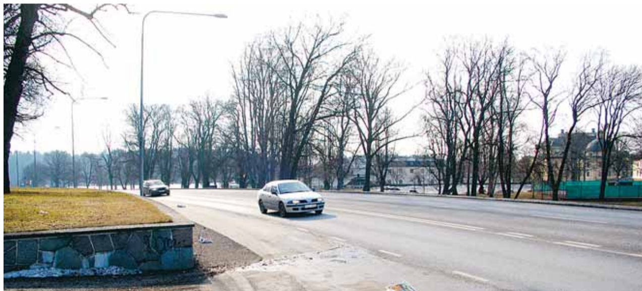
Flera partier ville ha svar på hur det går med de vändbara körfälten på Ekerövägen under senaste kommunfullmäktige.