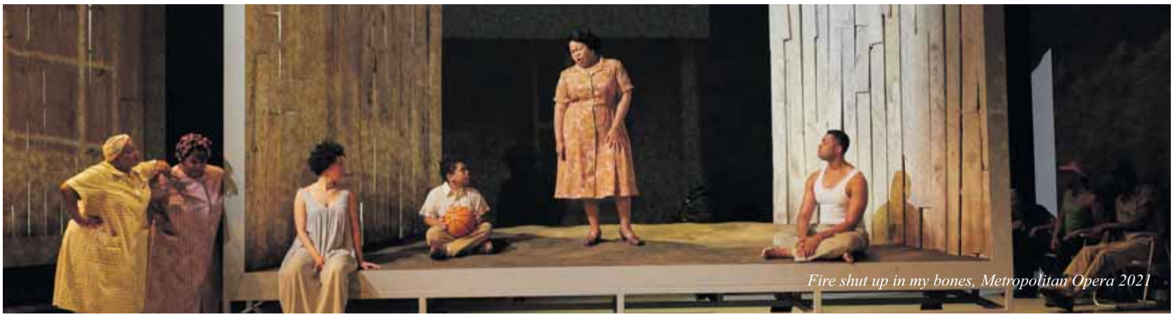
Fire shut up in my bones, Metropolitan Opera 2021