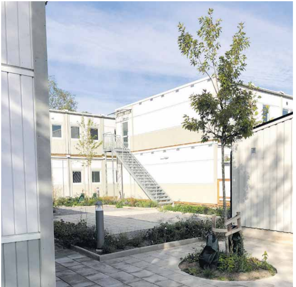
Boendemodulerna på 1880 kvadratmeter hyr Ekerö kommun på ett treårskontrakt för 223 311 kronor i månaden.