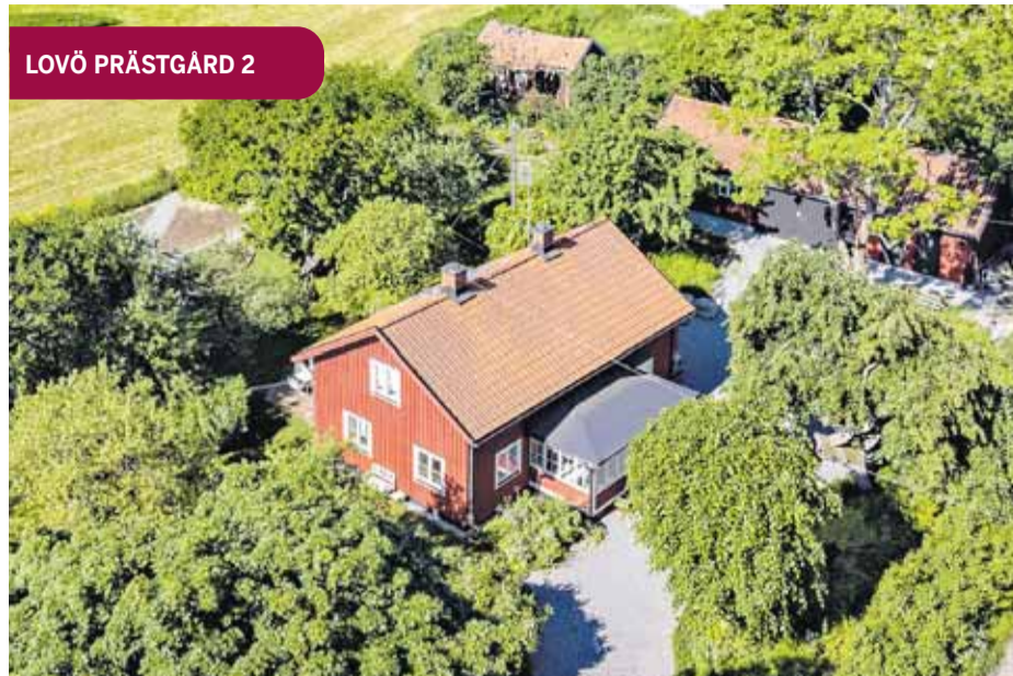
LOVÖ PRÄSTGÅRD 2