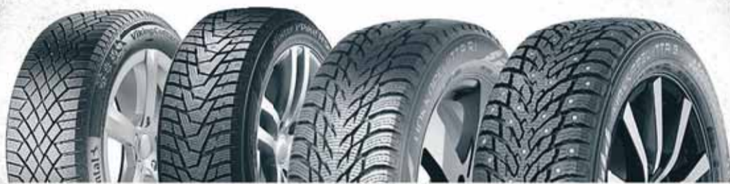
Continental VC7 Friktion

Continental GOODYEAR nokia TYRES MICHELIN Laufenn HANKOOK