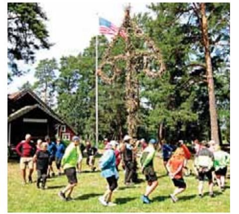
Amerikansk kultur möter svensk på Färingsö hembygdsgård. Sid 27.