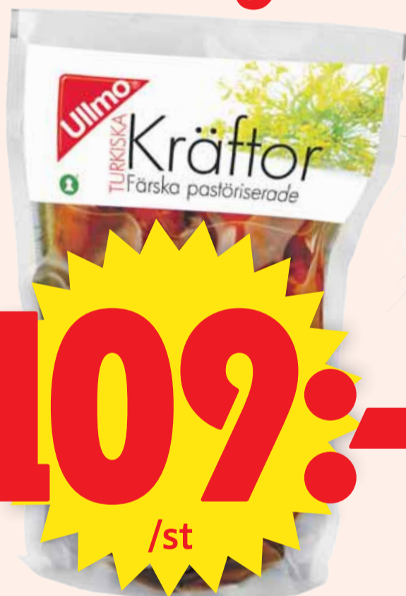
Färska kräftor Ullmo. 700 g. I dillag. Ursprung Turkiet. Jfr pris 155:71/kg utan spad.