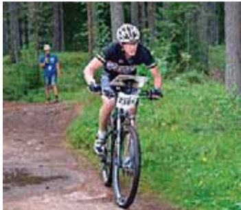
Cyklister letar kontroller utmed stigarna.

MTBO | Den 25 augusti arrangeras SM i mountainbikeorientering på Ekerö. Under några intensiva timmar kommer skogarna runt Jungfrusund vara fyllda av cyklister i alla åldrar som letar kontroller.