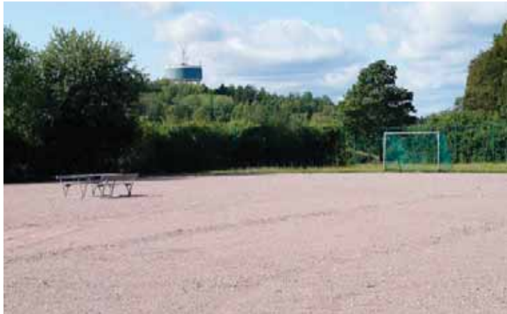
Fotbollsplanen nedanför Ekebyhovskolan ska bli aktivitetsyta. Tidigare har den dock varit aktuell för att omvandlas till parkeringsplats för besökare till Mäläröhallen. I dagsläget är det ont om p-platser för besökare till hallen och boende i området ifrågasätter planerna för aktivitetsytan.

– Detta fullständigt amatörmässigt utförda A4-ark skulle visa på att 100 bilar ska kunna parkera på fotbollsplanen i samband med aktiviteter i sporthallen. Bortsett från att denna ritning är helt orealistisk, det går inte att klämma in så många bilar på den ytan, så var den