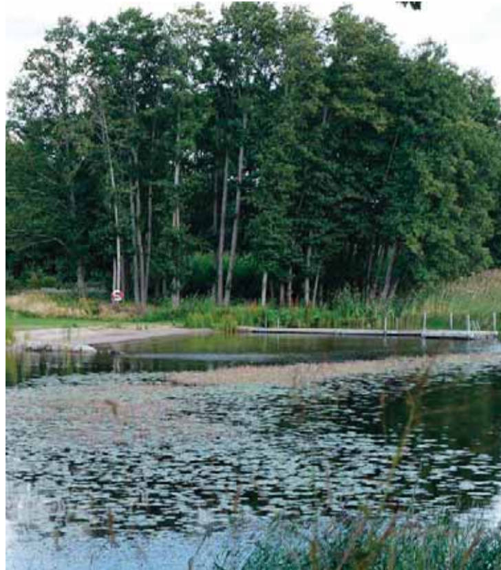
Boende intill stranden på bilden på Gällstaö blev rejält uppskrämda då en man med gevär dök upp en söndagsförmiddag i juni och sköt ut mot vattnet. Det visade sig sedan handla om skyddsjakt, men mannen kom civilklädd till en början och kunde inte heller visa upp legitimation.

På kommunens hemsida står att "Skyddsjägarna bär legitimation och gula varselvästar med texten