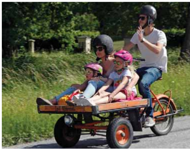
Alla tänkbara typer av fordon deltog i det välbesökta veteranloppet som stadigt ökar i storlek från år till år.