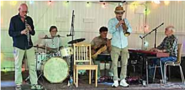
Jazz Jazzkvällarna på Skå festplats startade den 26 juli med Spader Jazz som spelade svängig jazz i New Orleansstil. Arrangerade gjorde Jazz på Mäläröarna i samverkan med Skå festplats.