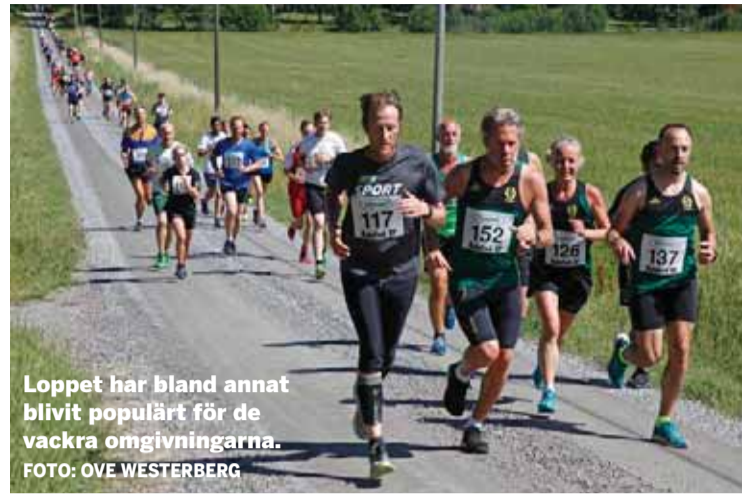
Loppet har bland annat blivit populärt för de vackra omgivningarna.