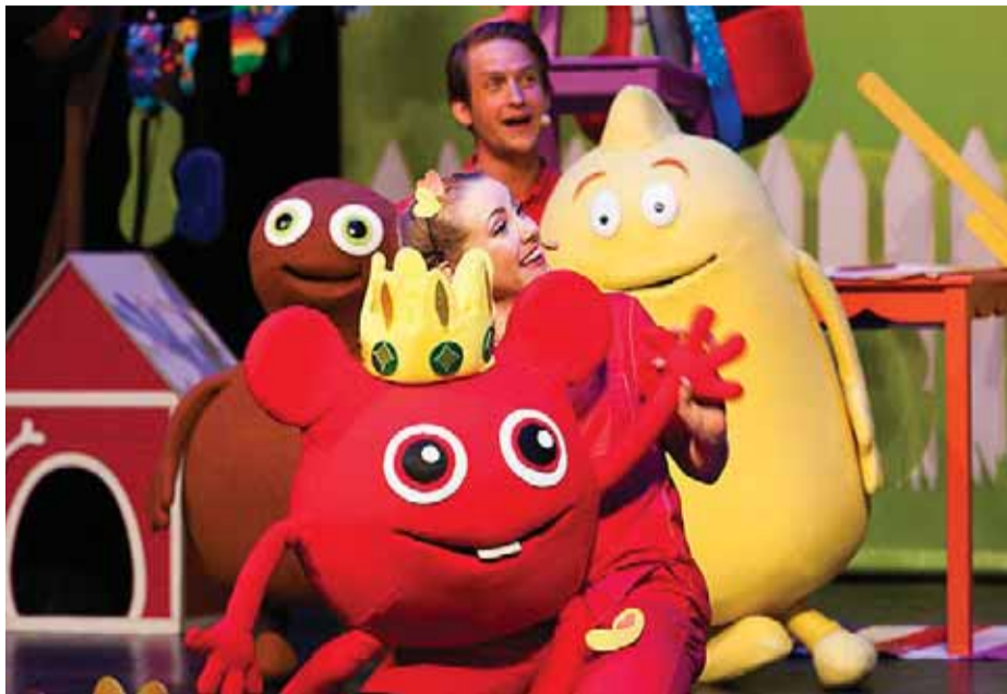
”Babblarna – Andra musikalen – Bibbel Babel Bubbel” kommer till Ekerö och Erskinesalen 19 oktober med tre föreställningar på rad.

”...det är egentligen ren språk- och talträning, men det vet inte barnen. De har bara kul”