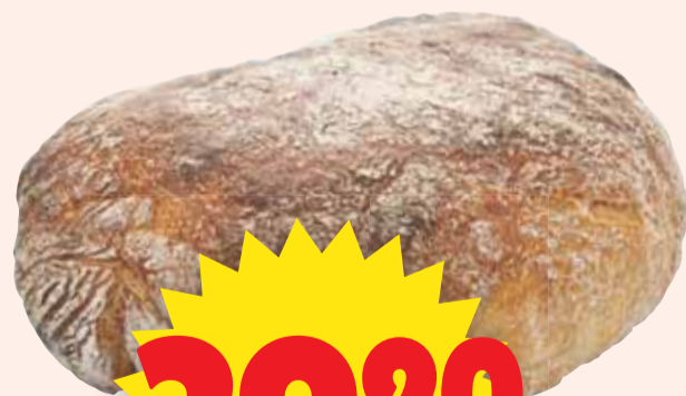
Grand Blanc Gateau. 600 g. Vårt bästa surdegsbröd. Jfr pris 66:50/kg.