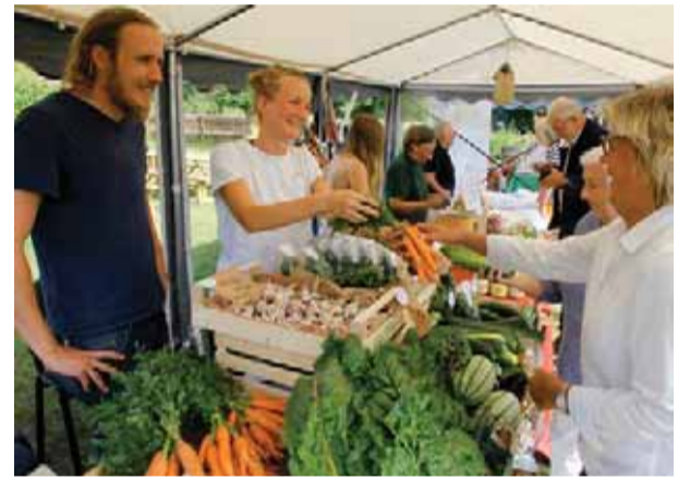
Adelsö hembygdslag höll sin traditionella hembygdsgård den 11 augusti. På programmet stod som vanligt marknad, musik, lotteri och storbak i bagarstugan. Några som hade glada kunder var öns nya grönsaksodlare Noble farming från Sättra gård.