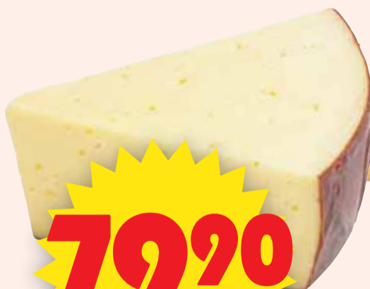
Brännvinsstubbe Ostgruppen. Ca 1 kg. Lagrad över 12 månader. Jfr pris 79:90/kg.