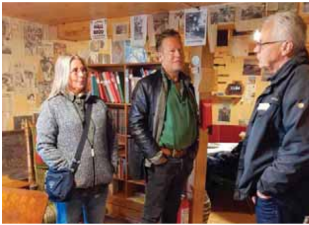
Museum Munsö hembygdsgård Bertil Ifwers museum hade sitt årliga öppna hus i början av sommaren. Både gamla och nya besökare uppskattade tidsresan bland alla rum och föremål. Det bjöds på hembakat och musikunderhållning.