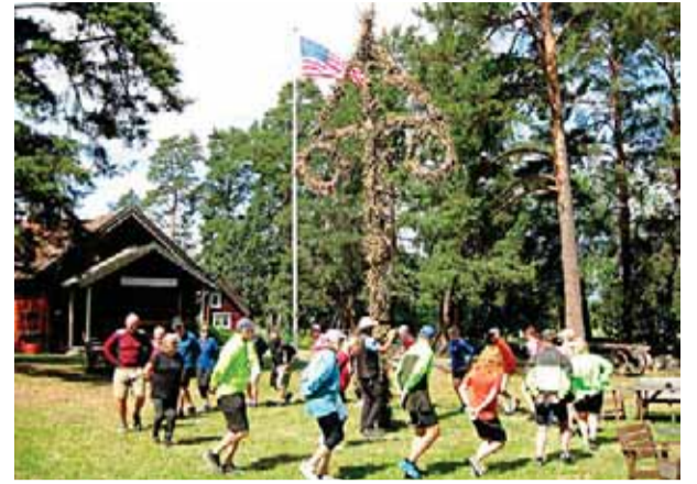
Svenska traditioner Vermont Bicycling and Walking Vacations gör regelbundet utflykter till Färingsö hembygdsgård under hela sommaren och hösten. Resenärerna cyklar bland annat från Drottningholm till Färingsö hembygdsgård där de får en guidning, äter smörgåstårter och dansar "Små grodorna" runt midsommarstången.