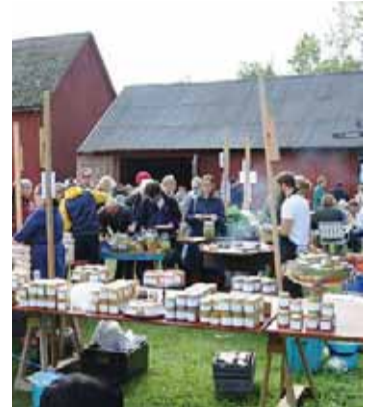
Lovö marknad och hembygdsdag är ett populärt evenemang. De engagerade föreningarna oroar sig dock för hembygdsgårdens framtid.

– I övrigt arbetar kommunen med många olika kulturmiljöfrågor. Vi jobbar aktivt med miljön runt Ekebyhovs slott, utvecklingen av ett skydd av naturen runt Jungfrusundsåsen samt att vi till-