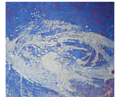
Målning av Gudrun Andersson

– Jag spänner upp och grundar dukarna själv, sedan lägger jag en undermålning i rött. Det röda ger energi och kraft. Det röda kan vara både blod och jordens inre värme.