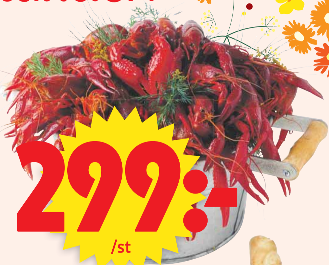
Färska svenska kräftor ABC food. I hink. Jfr pris 299:00/kg.