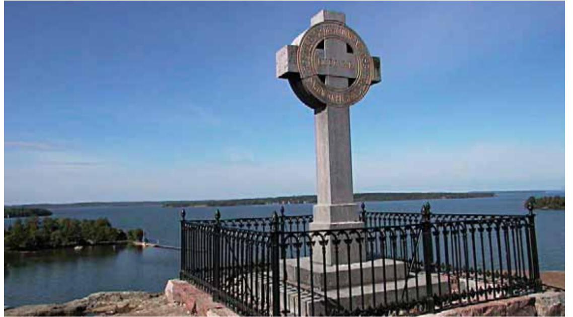
Personal och forskare menar att bristande resurser gör att Birka förfaller och att det behövs politiska beslut för att komma till rätta med problemen.

Kulturminister Amanda Lind kommenterade ärendet den 7 juli till SVT med följande uttalande: ”Det finns idag inga planer på att ändra ansvarsförhållandena mellan myndigheterna. Med det sagt är alla våra världsarv värdefulla och ska skyddas och vårdas för framtiden. Regeringen har därför gett Riksantikvarieämbetet i uppdrag att utarbeta en nationell världsarvsstrategi som ska ge en samlad beskrivning av hur Sverige arbetar med Unescos världsarvskonvention och hur arbetet ska inriktas framöver. Arbetet med detta uppdrag pågår vid myndigheten och det arbetet kommer jag att följa.”