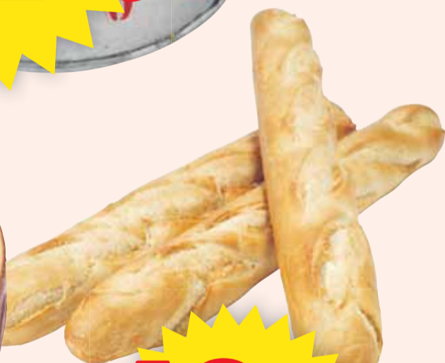
Baguette Bonjour. 400 g. Jfr pris 25:00/kg.